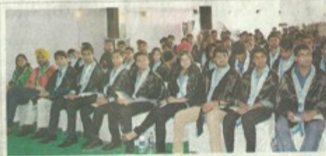
मंडी : आई.आई.टी. मंडी के कमांड कैंपस में पहले दीक्षांत समारोह में उपस्थित बी.टैक. प्रथम बैच के 94 पास आउट छात्र।