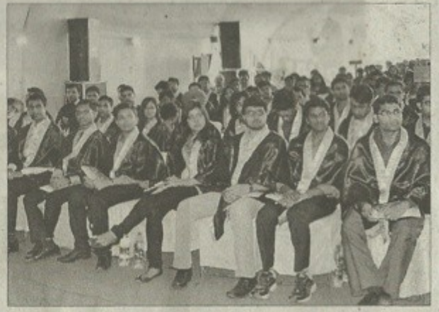
मंडी : भारतीय प्रौद्योगिकी संस्थान में आयोजित दीर्घांत समारोह में गौरव डिग्री प्राप्त करने वाले छात्रों को पहला मेडल